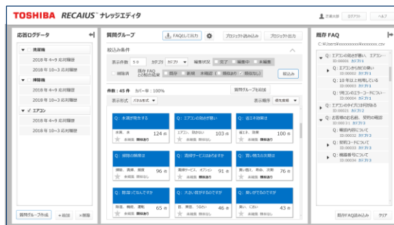
業務履歴グループ管理画面