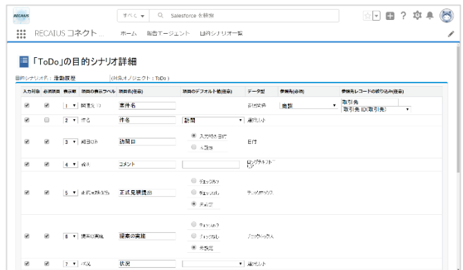
(図2:Salesforce連携時の設定画面例)