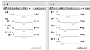
図1：声の調子・感情編集画面イメージ

-感情や話す速さ・声の高さ・声の太さなどの声の調子をカスタマイズ、1文毎に話者の設定を保存可能（図1）