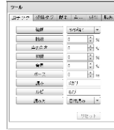
図3：タグ入力サポート画面イメージ

-「タグ入力サポート」機能により、文の一部への感情付与や、読み上げ方の詳細な調整が可能（日本語話者のみ）（図3）