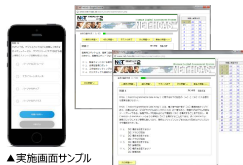
▲実施画面サンプル